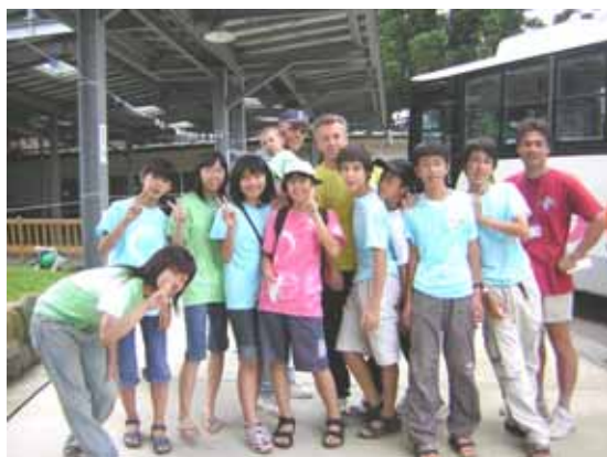
キャンプが終わり、帰る前に撮った関西組集合写真

三日目は近くにあるうさぎ平にハイキングに行きました。リフトを使って登っていき、頂上からの景色が最高!とてもきれいでした。リフトから物を落としたり人がいて大騒がせでした。