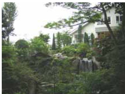
自然が いっぱい幼稚園