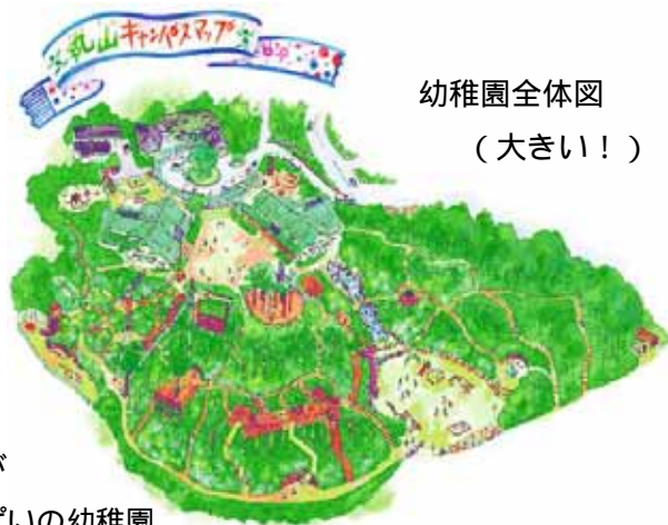
幼稚園全体図 (大きい!)