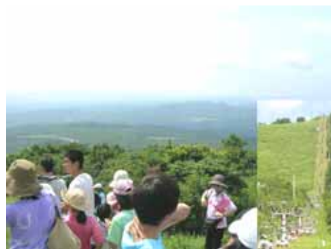
うさぎ平の頂上 (きれい)