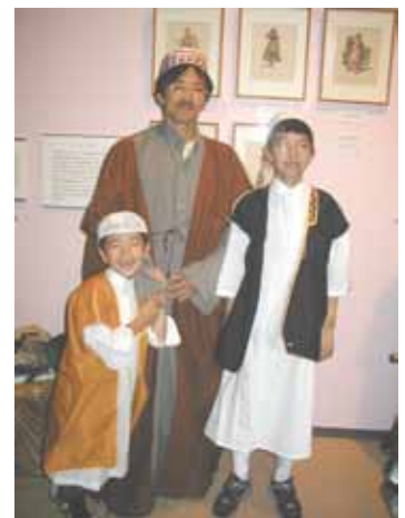
どう?! アラブの衣装似合うかな。この衣装はエジプトの街で売られているものだそうです。