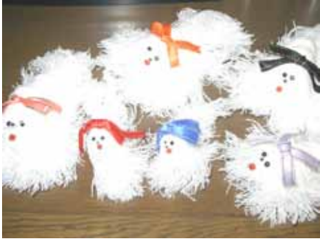
生涯学習講座で作った 「ワンちゃん」