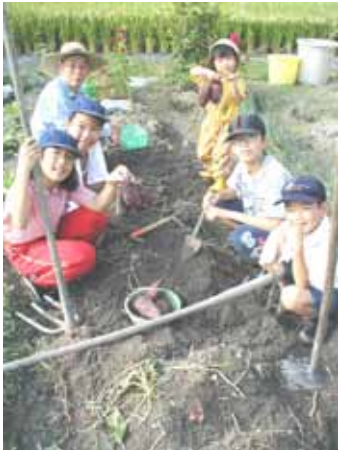
一番大きいおいも、 八五〇gでした。